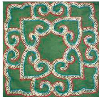
Фото 7 Образцы традиционных узоров Аину.