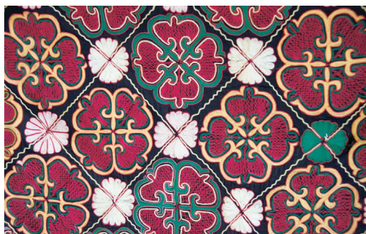
Фото 3 Казахский узор овечья почка, называемая по казахски Builek (бүйлек). Это также означает богатство.