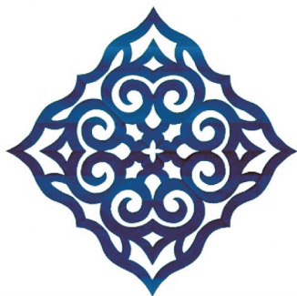
Фото 5 Образцы традиционных узоров Аину.