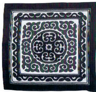
Фото 9 Узор нанайцев.

идентификации собственных узоров от аналогичных узоров других этнических групп. Кроме того, они склонны думать, что образы в которых присутствуют изогнутые линии являются казахскими.