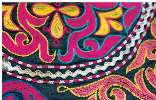
Фото 4 Образы насекомых, называемые алакурт (ала құлт), выражены как красно-белая полоса.