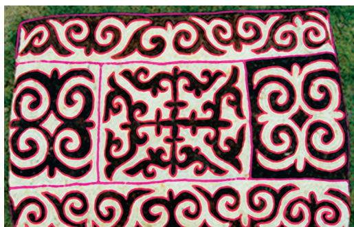
Фото 2 Традиционный казахский узор бараний рог, называемый “Sirmahtin Oyu (сырмақтың ою)” используемый на войлочном ковре.