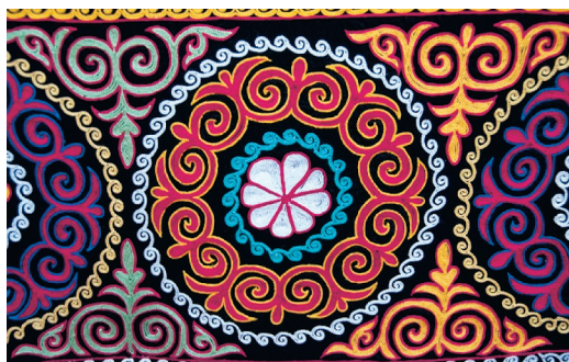
Фото 1 Образы рогов барана используемые для настенной вышивки. Внутри узора рогов имеется еще и цветочный узор.