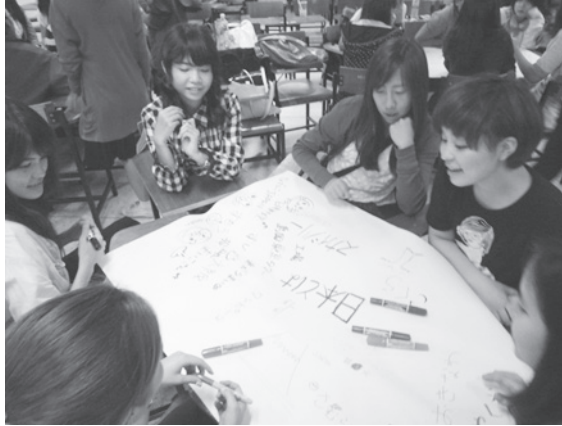
【写真3】 タイ人学生と日本人学生とがアイデアを出し合う。