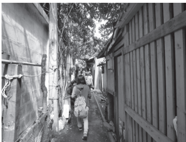
【写真6】 クロントイ地区の都市スラムを訪問する。

区を訪問し、スラムに暮らす子どもたちが通う幼稚園で交流を深めた（【写真5】【写真6】）。