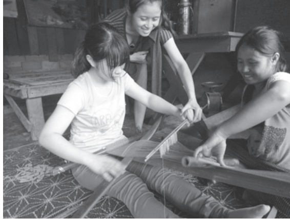
【写真2】 機織り機を使った伝統的な織物作りを村人から教わる。

は日本とは全く異なる環境に身を置いて生活しながら、日本の生活環境をふりかえる機会を持った。