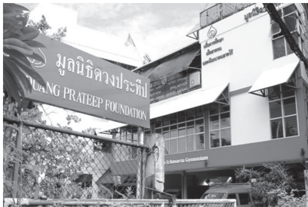
【写真5】 プラティーブ財団にてスラムの歴史や現状を学ぶ。