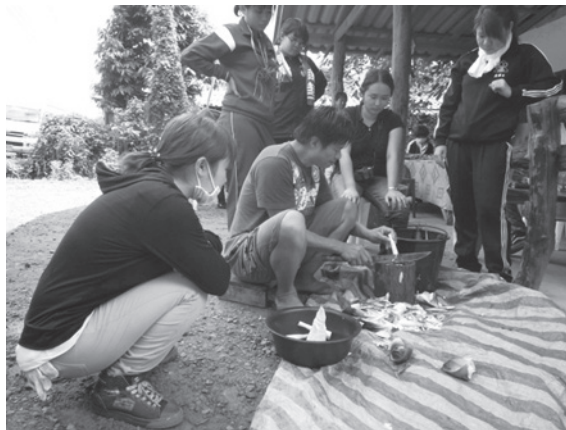
【写真1】 村人とともに里山から山菜などを採取して調理する。

農村ホームステイでは、村の食生活や伝統文化を通じて、村人の生活のしくみを学んだ。学生