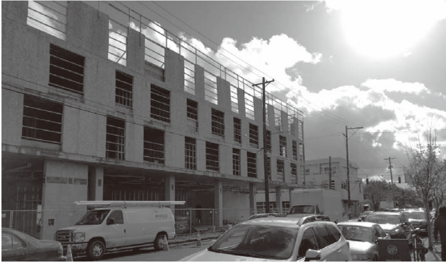
図10 ボイジーで建設中のコンドミニアム

第2の課題として、本稿で取り上げてきたような「第三の消費文化」とは異なる側面も照射する必要があるだろう。たしかに、典型的なグローバル・チェーン店やショッピングモールといった典型的なアメリカ消費文化はポートランドの中心部ではあまりみられない。しかし、少し郊外に目を転じれば、ポートランド国際空港近くや82nd Ave.以東には多くのショッピングモールやロードサイドショップが存在する。また、今回のフィールドワークで訪れたネイバーフッドの1つであるモンタヴィラの82nd Ave.沿いには、ベトナム系移民が経営するベトナム料理店が多数あり、ある種のコミュニティを形成しているようであった。ポートランドの消費文化をより精密に描写するためには、いわゆる「ポートランド的なもの」とそうでないものの文化的な相互作用についても検討する必要がある。