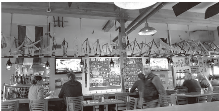
図6 Hopworks Bike Bar

さて、ポートランド市街における移動（mobility）に着目すると、ポートランドでは、街区（city block）が歩行者に親しみやすいように（pedestrian friendly）小規模（60m程度の規模）で構成され 7) 、ポートランド市は生活上の基本的なニーズを徒歩移動可能な（walkable）エリアで満たすというコンセプト“20-Minute Neighborhood”を推進してきた（MURP Workshop Projects 2009: 9-13）。さらに、ほとんどの通りには自転車レーンが整備され、多くの市民が自転車を日常移動手段として利用し（自転車シェアリングを含む）、趣味として愛好することで世界的に名高い。自転車をテーマとし、自転車のフレームなどのパーツを店内オブジェとするユニークなカフェがあるほどである（図6）。また、バス、電車（MAX Light Rail, WES Commuter Rail）からなる公共交通機関が充実し、駅の24時間無料の駐輪場が整備され、パーク・アンド・ライドが推奨され 8) 、バスには乗客が自転車を固定できる設備があり、自転車移動にバス利用を組み込めるようになっている。