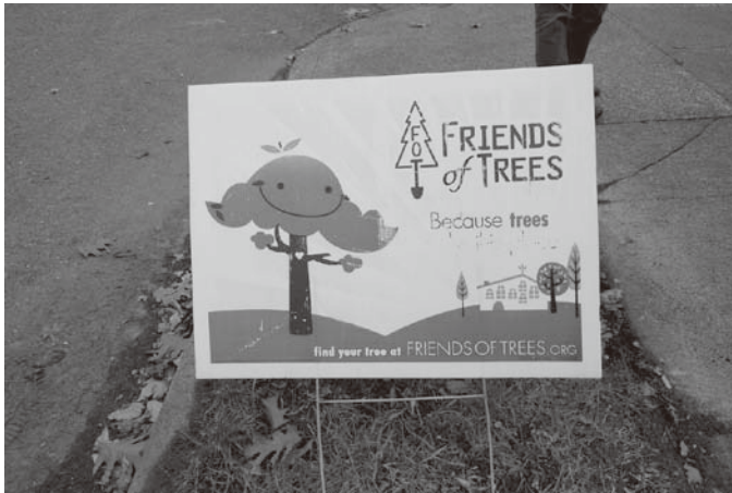
図3 植樹運動のNPOのプラカード