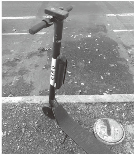
図7 社会実験で利用されている e-scooter

生活しているといった自然・生活環境保護が浸透した生活文化イメージが浮かぶだろう。だが、それはそれで間違いではないものの、自動車（自家用車）を日常移動手段として用いないわけではなく、郊外地域には自動車移動を前提としたショッピングモールもあれば、交通渋滞も生じている。それでも、こうした交通渋滞の緩和、ガソリン燃料自動車の利用によるCO 2 排出量の削減を目的として、新しい移動手段の導入も模索されている。今回のフィールドワークでは、電動キックボードといってよいe-scooterシェアリングの社会実験（Shared E-Scooter Pilot Program）がポートランド市主導で実施されていた（図7） 9） 。本社会実験は2018年7月～11月の120日間での実施であったが、2019年4月からは1年間の社会実験が計画され、e-scooterシェアリングの本格導入も近いことが予想される。