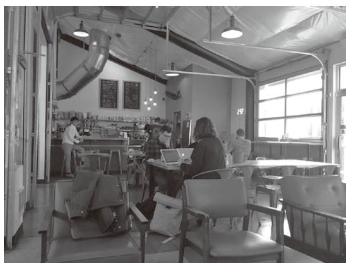
図8 Spin Laundry Lounge 10)

さらにいえば、Urryらの議論にしたがえば、自動車システムは資本主義経済のシステムであるフォーディズム、ポストフォーディズムとの関連が指摘される（Urry 2005=2010）。他方、ポートランドの事例からみると、ポスト自動車システムは、資本主義経済に対するオルタナティブ経済におけるスモールビジネス（小商い）との関連を指摘でき、こうしたスモールビジネスと地域コミュニティの形成・活動との間には相互促進する再帰的な関係があるように思われる。たとえば、本稿「3 ローカル志向」で後述するように、ポートランドには地域に根付いたクラフトビールのブルワリーやサードウェーブ系の小規模経営のコーヒーショップが数多くあり（図8）、それらは市民の日常移動における「中間空間(inter space)」(Urry 2007=2015: 357)として機能し、交流の場所(非場所ではない！)として広く利用されている。