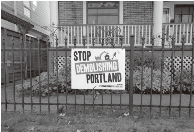
図4 生活環境保護を目的とした社会運動団体のプラカード

前述した社会運動団体のサイトでは 4) 、住宅や近隣地域の保全がテーマになっているが、住宅などの建造物の解体に関してはポートランド市が、建造物の解体にともなう破片・がれきを建築廃材（中古資材）としてサルベージし、リユース・リサイクルの最大化を推進している。ポートランド市は12の専門解体業者を認定しているが 5) 、そのなかには今回フィールドワークをおこなったThe ReBuilding Center も含まれる（cf. 間々田他 2017: 58-9）。The ReBuilding Center は専門技術を用いた手作業の解体サービス “DeConstruction Services” を提供し、建築廃材をDIY向けに販売している（図5） 6) 。