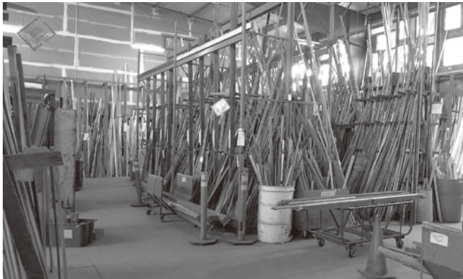
図5 The ReBuilding CenterがサルベージしDIY向けに販売している建築廃材

さて、ポートランド市街における移動（mobility）に着目すると、ポートランドでは、街区（city block）が歩行者に親しみやすいように（pedestrian friendly）小規模（60m程度の規模）で構成され 7) 、ポートランド市は生活上の基本的なニーズを徒歩移動可能な（walkable）エリアで満たすというコンセプト“20-Minute Neighborhood”を推進してきた（MURP Workshop Projects 2009: 9-13）。さらに、ほとんどの通りには自転車レーンが整備され、多くの市民が自転車を日常移動手段として利用し（自転車シェアリングを含む）、趣味として愛好することで世界的に名高い。自転車をテーマとし、自転車のフレームなどのパーツを店内オブジェとするユニークなカフェがあるほどである（図6）。また、バス、電車（MAX Light Rail, WES Commuter Rail）からなる公共交通機関が充実し、駅の24時間無料の駐輪場が整備され、パーク・アンド・ライドが推奨され 8) 、バスには乗客が自転車を固定できる設備があり、自転車移動にバス利用を組み込めるようになっている。