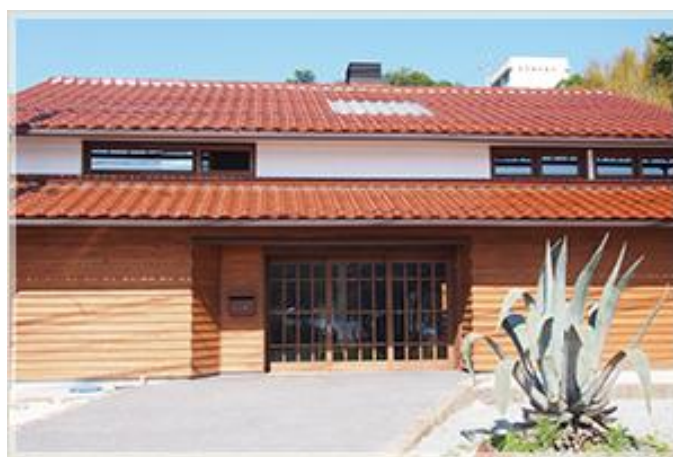
図1 隠岐國学習センターの正面

新校舎によって、塾生たちは集中して学習に取り組める環境を獲得し、地域住民にも開かれた交流スペースが用意された。この交流スペースにはカフェコーナーやWiFiが設置され、月曜日～土曜日の13時～22時で開放されている。