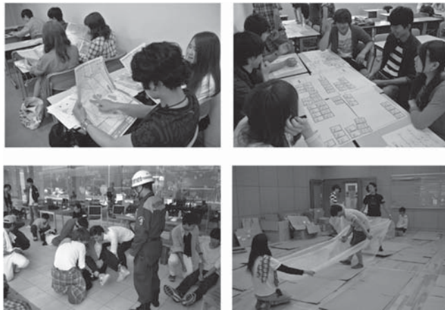
写真1 学習のようす